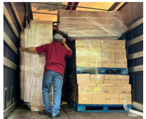
Lossen van de vracht in Chisinau, Moldavië

Tenslotte vragen wij uw aandacht voor het budget van in totaal Euro 9.500 dat we als OostEuropa Zending bijdragen aan deze conferentie. Uw blijmoedige gaven zien wij dankbaar tegemoet.