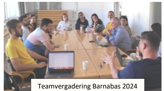
Teamvergadering Barnabas 2024

Het thema is dit jaar ontleend aan Gal. 2:20 er worden weer ruim 100 jongeren verwacht uit Albanië en omliggende landen en eventueel uit westerse landen. Op vrijdag 12 april jl. werd een voorbereidende meeting gehouden (zie foto) waar alle nodige details besproken werden en het verdere werk tot en met de conferentie zelf (22-26 juli) aan de Heer werd opgedragen.