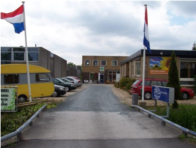
Bezoekers van de Groene Weg Winkel komen letterlijk over de brug

OEZ Zendingscentrum - Op 3300 vierkante meter God en medemensen dienen met Woord en Daad